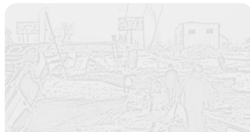
令和4年7月のウクライナの様子

考えました。戦争は最低限度の生活を営む権利を奪ってしまう人権侵害であることにもふれ、日本国憲法についても少し考える機会となりました。また、クラスでは仲良く楽しく過ごせているかについて再確認しました。