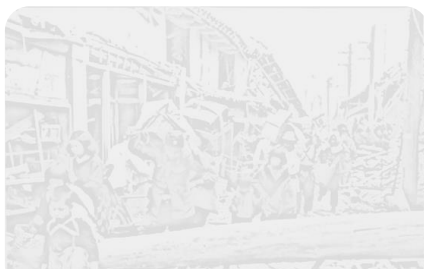
昭和20年の日本の様子

全校登校日に平和集会を行いました。全校で「火垂るの墓」を鑑賞した後、作品に描かれている時代の写真と現在のウクライナの写真を見比べ、戦後77年経った今、再び当時と変わらぬ姿になっていることについて